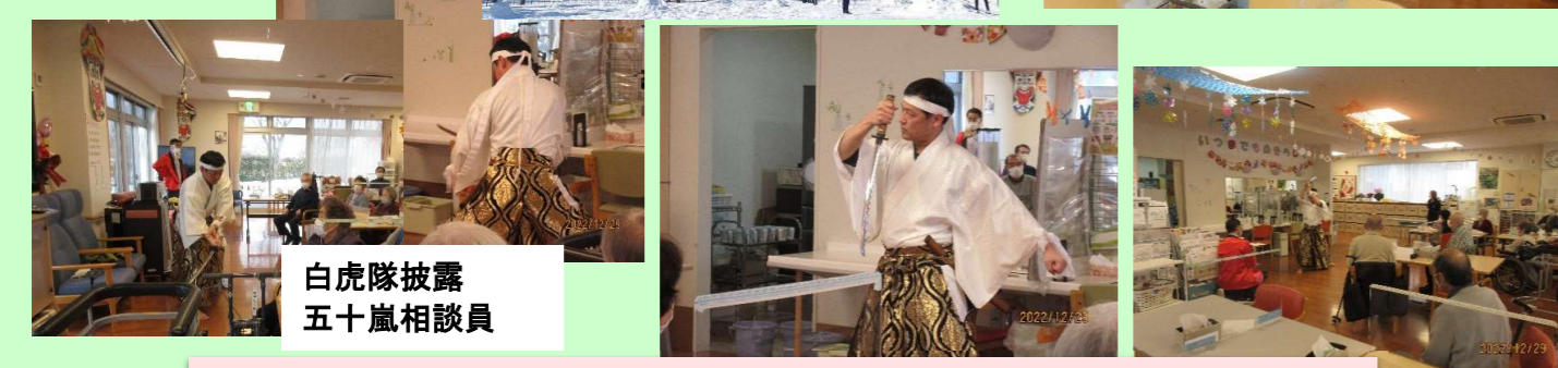
白虎隊披露 五十嵐相談員

楽しくなければデイじゃないをモットーに 今年の締めくりも職員一同頑張りましたー♪ 楽しんでいただけましたか？