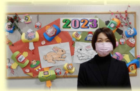
デイサービス相談員