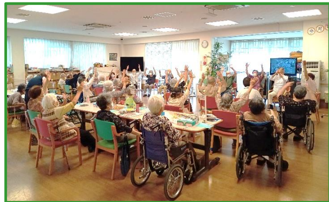
明るく広々としたデイフロア

明るく経験豊かなスタッフが、お一人おひとりに 寄り添い、自立とふれあいのための充実した サービスをご提供致します。