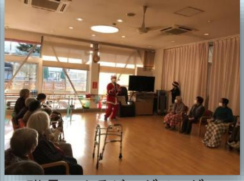
職員によるジャグリング！！