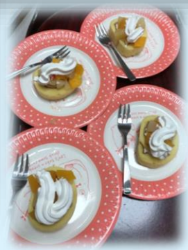
クリスマスのおやつ