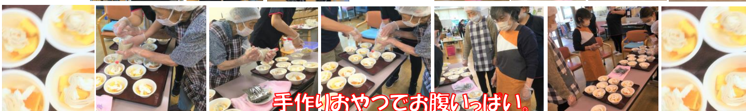
手作りおやつでお腹いっぱい！