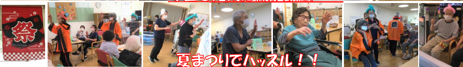
夏まつりでハッスル！！