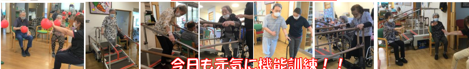
今日も元気に機能訓練！！